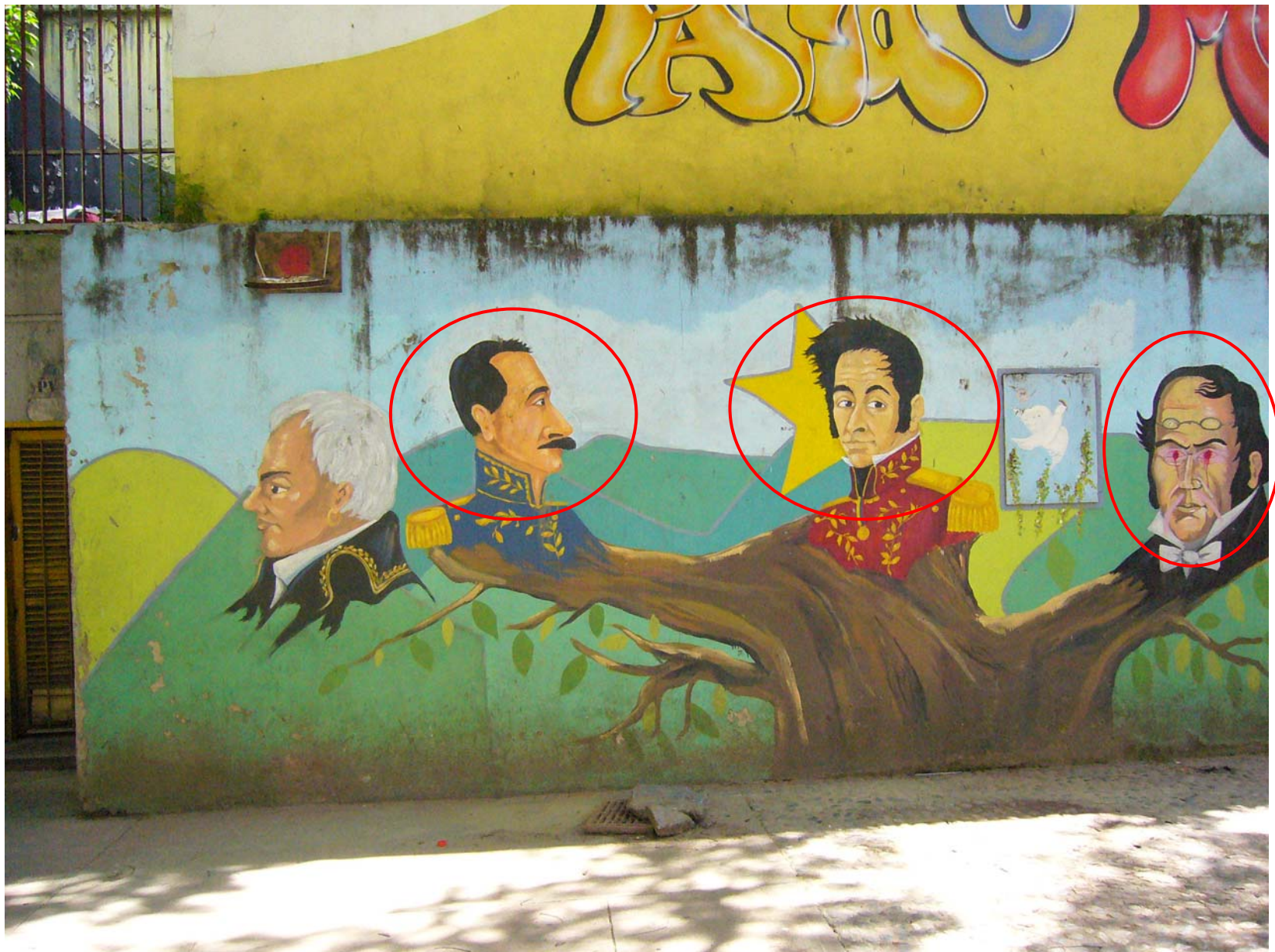
Fresque murale, Caracas, Plaza de la Revolución (09/2007)